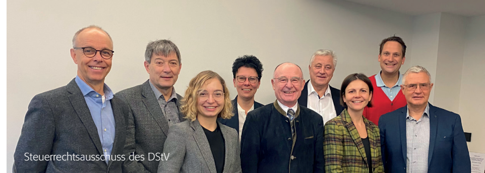
Steuerrechtsausschuss des DStV

den Berufsstand auch im Jahr 2022 noch erheblich beanspruchen werden. Umso wichtiger sei es, die Vertretungsbefugnisse des Berufsstands etwa im Bereich des Kurzarbeitergeldes gesetzlich sachgerecht abzubilden. Des Weiteren